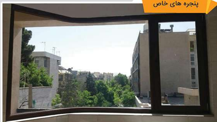
پنجره های خاص